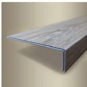
TYP C FLOORIFY